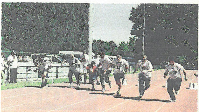
L'edizione dello scorso anno degli Athletics Special Olympics